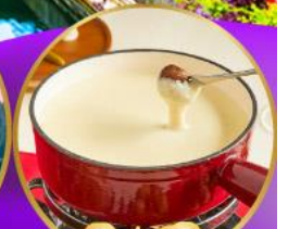
ฟองดูซีส