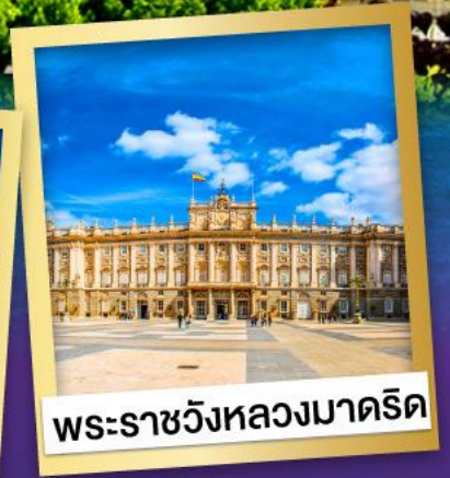
พระราชวังหลวงมาดริด