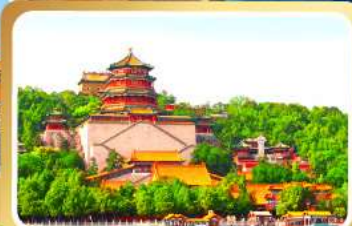
พระราชวังฤดูร้อนอ้อเหอหยวน