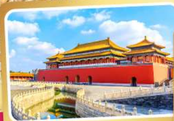
พระราชวังโบราณปักกิ่ง