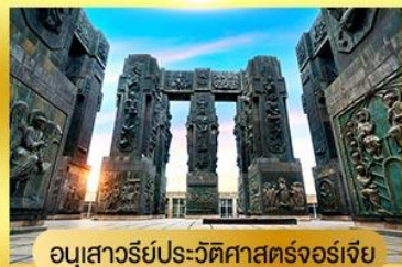
อนุสาวรีย์ประวัติศาสตร์จอร์เจีย

พิเศษ!! พัก ROOMS HOTEL ชมวิวสุดอลังการของเทือกเขาคอเคซัส