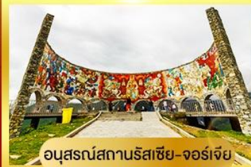
อนุสรณ์สถานรัสเซีย-จอร์เจีย

นั่งรถ 4WD ตะลุยสู่ใจกลางเทือกเขาคอเคซัส | เข้าชมวิหารศักดิ์สิทธิ์ ซามิบา เที่ยวเมืองท่าอันเก่าแก่ อพอลิสต์ซิคห์ | พิเศษ มื้ออาหารไทย ณ กรุงทบิลีซี