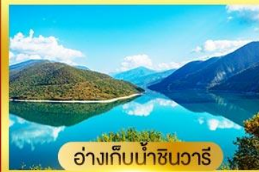
อ่างเก็บน้ำชินวารี