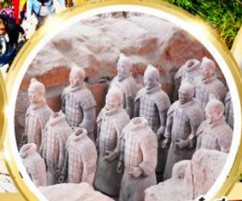
กองทัพทหารดินเผาจีนซี