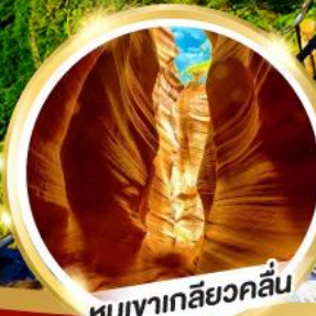
หุบเขาเกลียวคลื่น