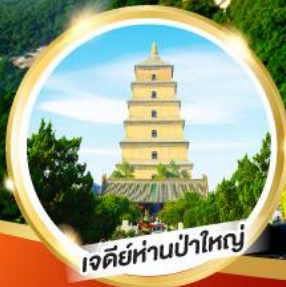
เจดีย์ห่านป่าใหญ่