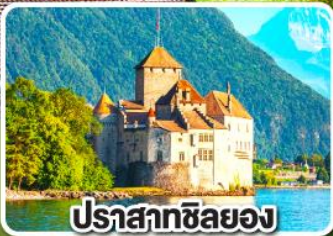
ปราสาทซิลยง