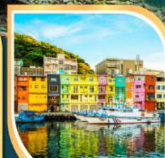
ท่าเรือเจิ้งปิ่น