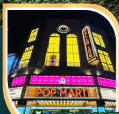
ร้านPOP MART ที่ใหญ่ที่สุดในไต้หวัน