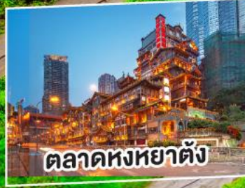
ตลาดหงหยาดัง

ไม่ลงร้านช้อปปิ้ง / เมนูพิเศษ สุกี้หม้อไฟ