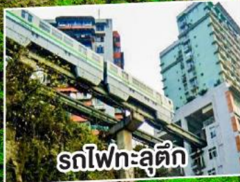
รถไฟฟ้าสุดคึก