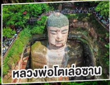
หลวงพ่อโตเล่อซาน