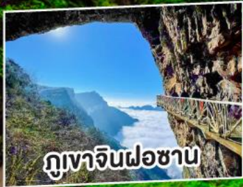
ภูเขาจินฝอซาน