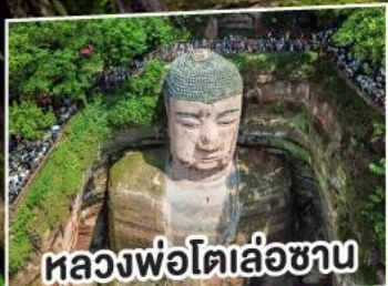
หลวงพ่โตเล่อซาน