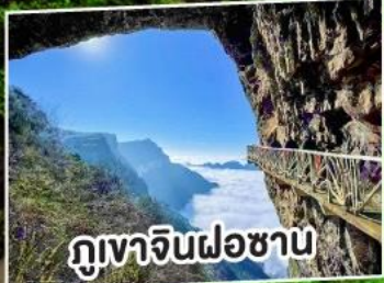
ภูเขาจินฝอซาน