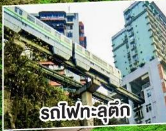
รถไฟฟ้าสุตัก