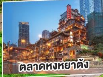
ตลาดหงหยาดัง