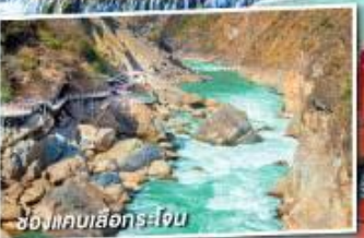
ช่องแคบเลือ่อกะโงน