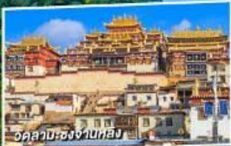
วัดลามะ-เซียงเป่ยกอบ

บินภายใน 1 เที่ยวบิน 5 วัน ไม่ลงร้านช้อปปิ้ง ไม่จ่ายออฟชั่น 4 คืน