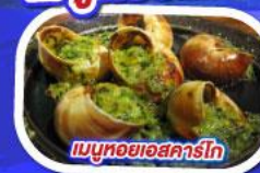
เมนูหอยออสการ์

ทานอาหาร ณภัตตาคารบนหอไอเฟล พร้อมชมวิวแสนโรแมนติก เมนูหอยแมลงภู่อบไวน์ขาว