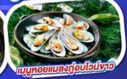
เมนูหอยแมลงภู่อบไวน์ขาว