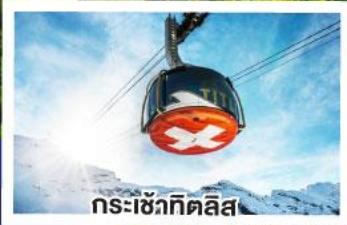
กระเช้าทิตลิส