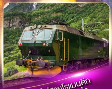
รถไฟสายโรเมนติก ฟลัมส์บาน่า