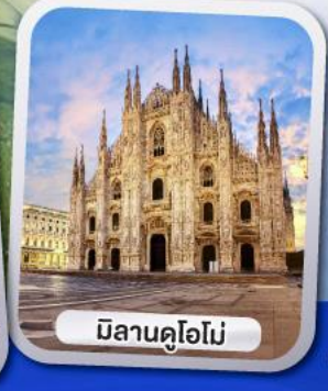
มิลานคูโอโม