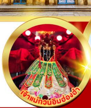
เจ้าแม่ทวนอิมฮ่องกง