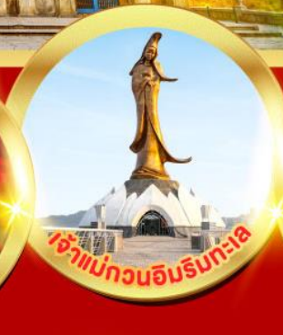
เจ้าแม่ทวนอิมริบทะเล