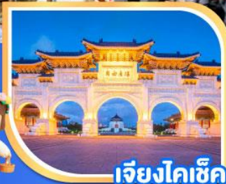
เจียงไคเช็ค