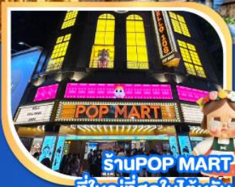
ร้าน POP MART ที่ใหญ่ที่สุดในไต้หวัน