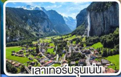
เลาเกอร์บรุนเนน