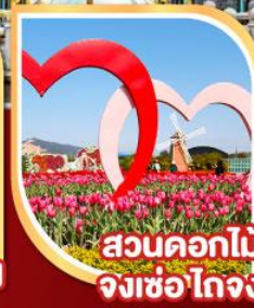
สวนดอกไม้ จงเซอโกจง