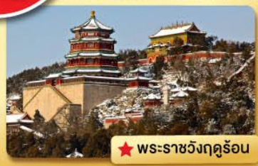
★ พระราชวังฤดูร้อน