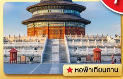
★ หอฟ้าเทียนถาน