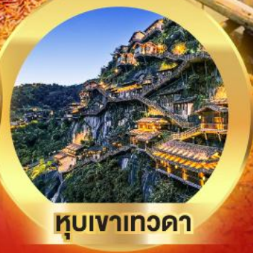
หุบเขาเทวดา