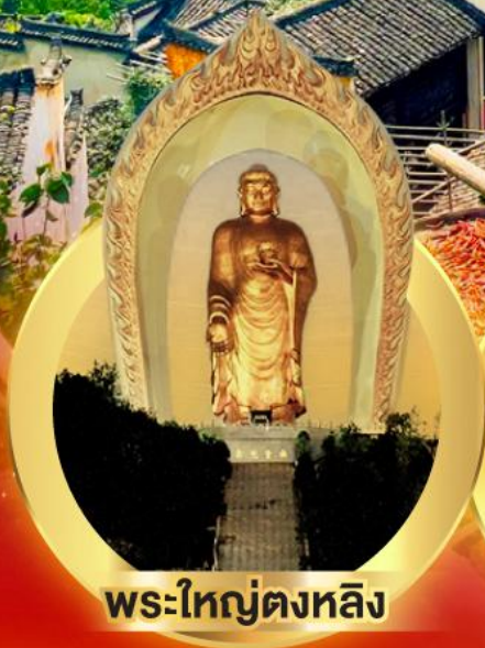
พระใหญ่ตงหลิง