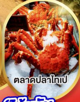
ตลาดปลาไทเป