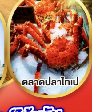
ตลาดปลาไทเป