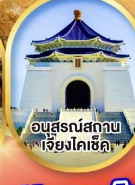
อนุสรณ์สถาน เจียงไคเช็ค