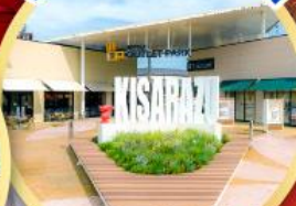
มิตซูชิ เอ้าท์เล็ต พาร์ค คิชะระชู