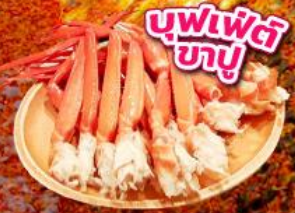
บุฟเฟ่ต์ ซาบุมิ

ชมใบไม้เปลี่ยนสี อุโมงค์ใบเมเปิ้ล โมมิจิโคโร