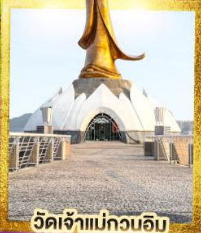
วัดเจ้าแม่กวนอิม