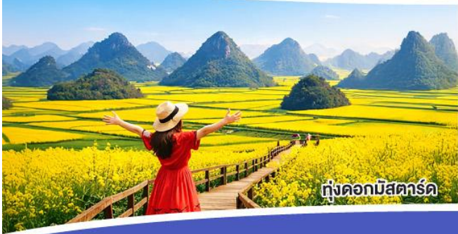
ทุ่งดอกมิสเตอร์ด