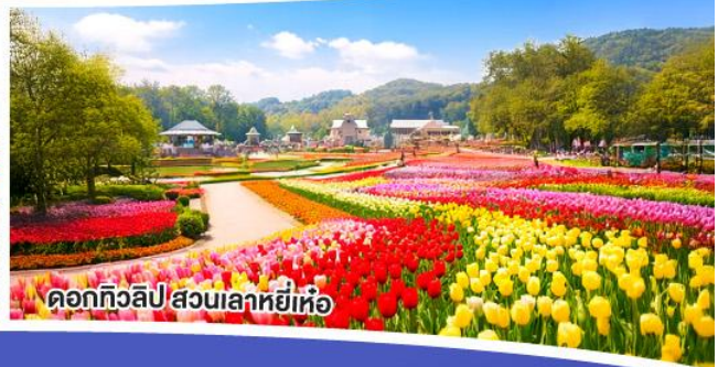
ดอกทิวลิป สวนเลาหยี่เหอ