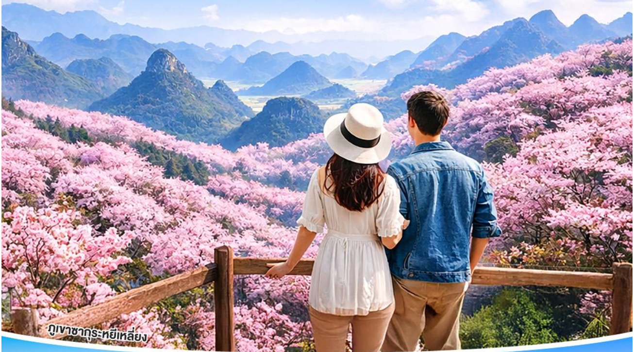
ภูเขาซากระหยีเหลียง