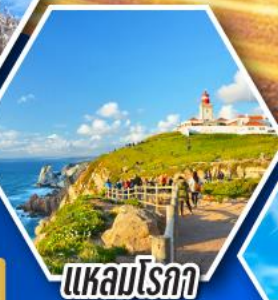
แควมโรกา