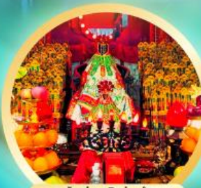
เจ้าแม่กวนอิมฮ่องงำ ขอพรเรื่องเงิน ทรัพย์สิน และความบันเทิง