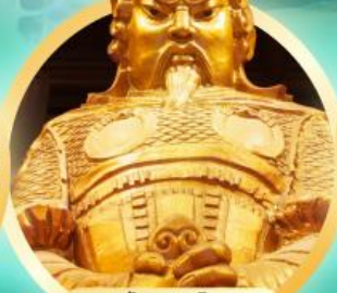
วัดเขangkหมิว ขอพรให้ท่านปลอดภัยกับบิณฑบาต