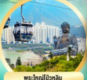
พระใหญ่ไป๋โหวลลิน ขอพรเพื่อความสงบใจ สุขภาพแข็งแรง และชีวิต