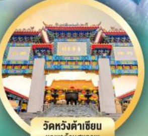
วัดหวังต้าเซียน ขอพรด้านสุขภาพ

เดินทาง 31 ต.ค.-02 พ.ย. 68 12-14, 26-28 ธ.ค. 68 16-18 ม.ค. 69 30 ม.ค.-01 ก.พ. 69 06-08 ก.พ. 69 06-08, 20-22 มี.ค. 69 27-29 มี.ค. 69