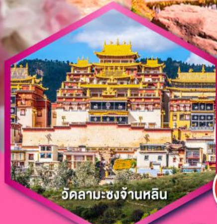
วัดลามะซงจ้านหลิน