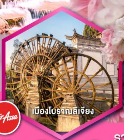
เมืองโบราณลีเจียง