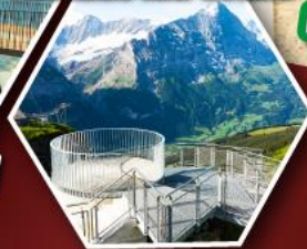
ฮาร์เดอร์คูลม