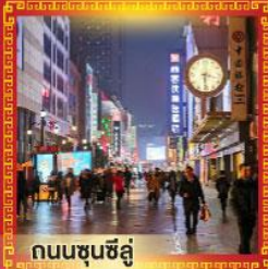
ถนนชุนชี่