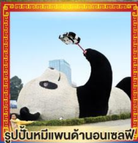
รูปปั้นหมีแพนด้าอนเซลฟ์!