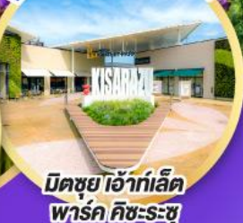
มิตซึย เอ้าท์เล็ต พาร์ค คิชะระซุ