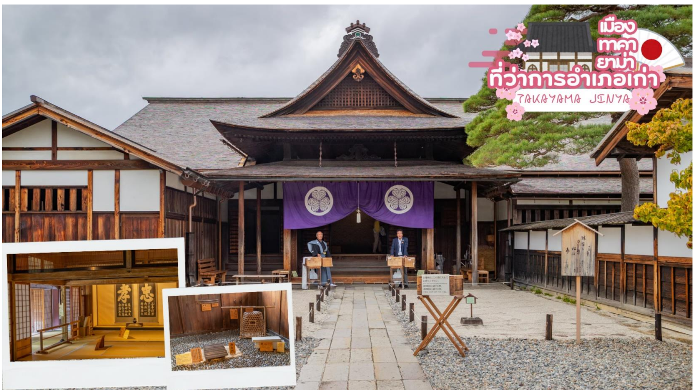
เมืองทาคายามา ที่ว่าการอำเภอเก่า TAKAYAMA JENYA

ผ่านชม ทาคายามา จินยะ หรือ ที่ว่าการอำเภอเก่าเมืองทาคายามา (ไม่รวมค่าเข้าชม) ซึ่งเป็นจวนผู้ว่าแห่งเมืองทาคายามา เป็นที่ทำงานและที่อยู่อาศัยของผู้ว่าราชการจังหวัดฮิธะ เป็นเวลากว่า 176 ปี ภายใต้การปกครองของโชกุนตระกูลกุกาวา ในสมัยเอโดะ ตัวอาคารเป็นทั้งสถานที่ราชการ ห้องรับแขก ห้องประชุม รวมถึงห้องสอบสวนอีกด้วย