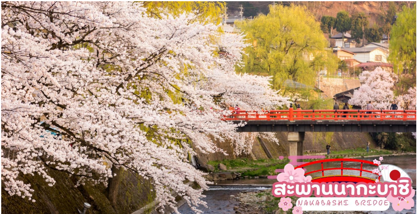
สะพานนากะบะชิ NAKABASHI BRIDGE

ผ่านชม ทาคายามา จินยะ หรือ ที่ว่าการอำเภอเก่าเมืองทาคายามา (ไม่รวมค่าเข้าชม) ซึ่งเป็นจวนผู้ว่าแห่งเมืองทาคายามา เป็นที่ทำงานและที่อยู่อาศัยของผู้ว่าราชการจังหวัดฮิธะ เป็นเวลากว่า 176 ปี ภายใต้การปกครองของโชกุนตระกูลกุกาวา ในสมัยเอโดะ ตัวอาคารเป็นทั้งสถานที่ราชการ ห้องรับแขก ห้องประชุม รวมถึงห้องสอบสวนอีกด้วย