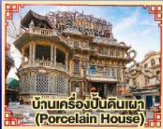
บ้านเครื่องปั้นดินเผา (Porcelain House)