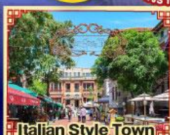
Italian Style Town