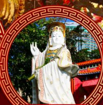
เจ้าแม่กวนอิม ริพัลส์เบย์