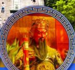
วัดกวนไท่