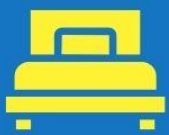
ห้องพักเดี่ยว SINGLE

ตัวอย่างประเภทห้องพัก *เป็นเพียงตัวอย่างเพื่อให้เห็นภาพสำหรับประเภทห้องในแบบต่างๆ