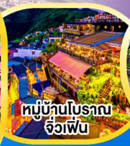
หมู่บ้านโบราณ จิวเฟิ่น