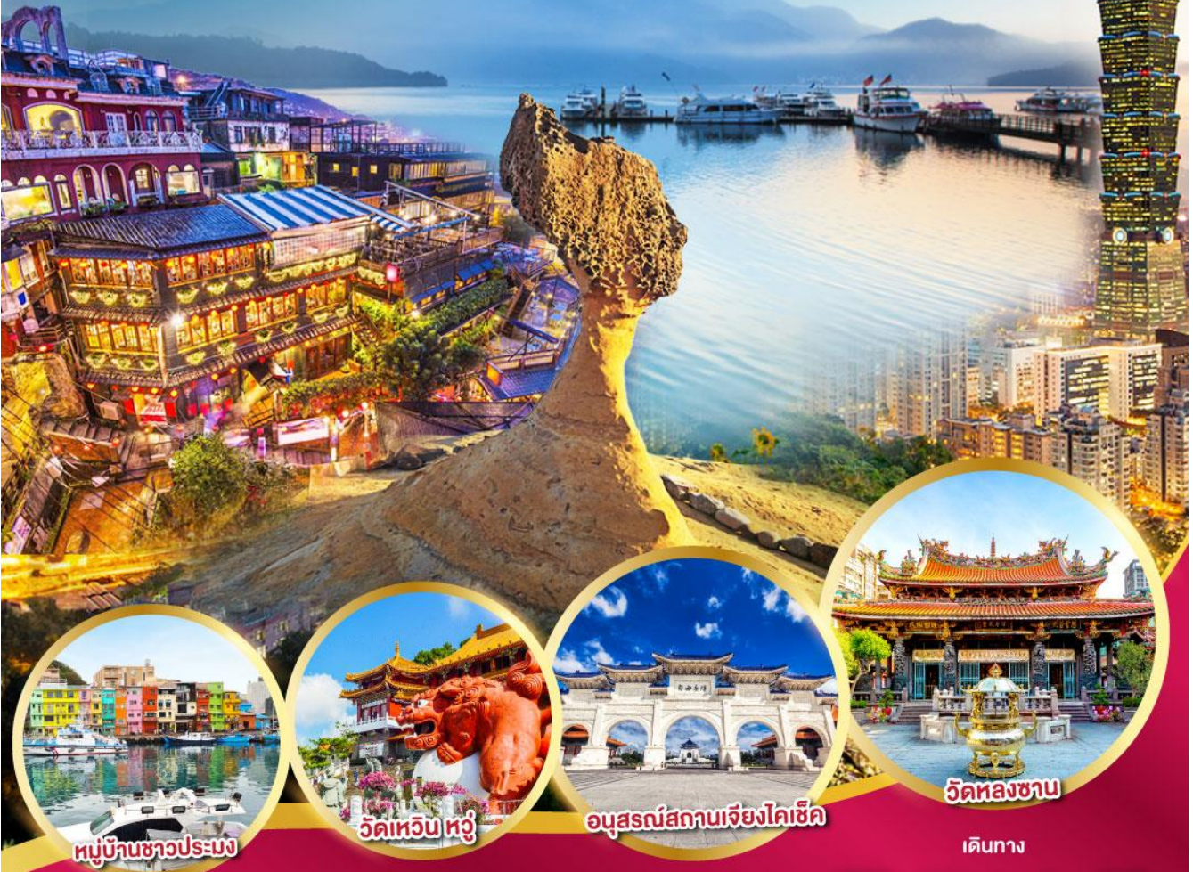
หมู่บ้านชาวประมง

ทะเลสาบสุรียันจินตรา อุทยานแห่งชาติเย่หลิว ถนนโบราณจิวเฟิ่น 5 วัน 4 คืน