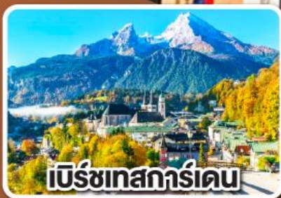
เบิร์ชเทสการ์ดเดน

เข้าชมเมืองเกลือโบราณ แห่งเมืองเบิร์ชเทสการ์ดเดน