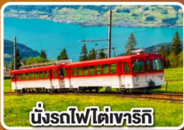
นั่งรถไฟใต้เขาโรทิก