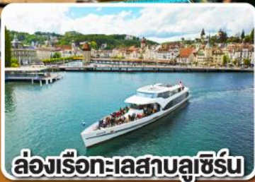
ล่องเรือทะเลสาบลูเซิร์น