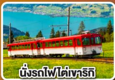
นั่งรถไฟใต้เขาริกิ