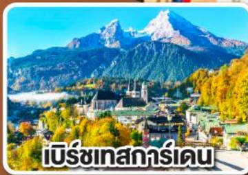
เบิร์ชเทสการ์ดเดน

เข้าชมเมืองเกลือโบราณ แห่งเมืองเบิร์ชเทสการ์ดเดน