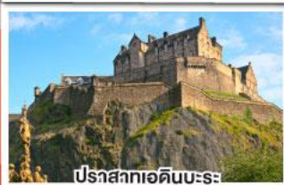
ปราสาทเอดิเนบะระ

เยือนสโตนเฮนจ์ และ พิพิธภัณฑน์โรมันโบราณ