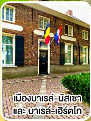
เมืองบารส์-นัสซา และ บารส์-เฮิร์ตโก