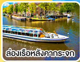
ล่องเรือหลังคากระจก

พิเศษ!! เมนูหอยแมลงภู่อบไวน์ขาว ล่องเรือหมู่บ้านไรถนน ที่รูร์น