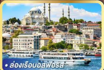
• ล่องเรือบอลฟอรัส