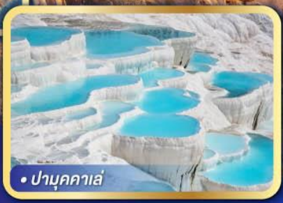
• ปามุกคาเล่