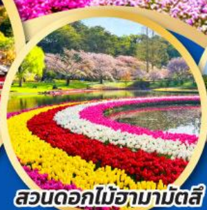
สวนดอกไม้ฮามามัตสึ