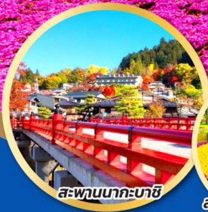
สะพานนาคะบาชิ