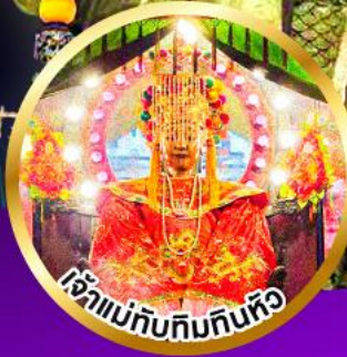
เจ้าแม่ทับทิมกินหัว