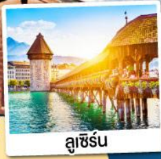
ลูซิิร์น

พิเศษ!! อาบน้ำแร่แช่น้ำอุ่น ณ เมืองลูคอร์เนด เมืองแห่งน้ำแร่สวีตเซอร์แลนด์