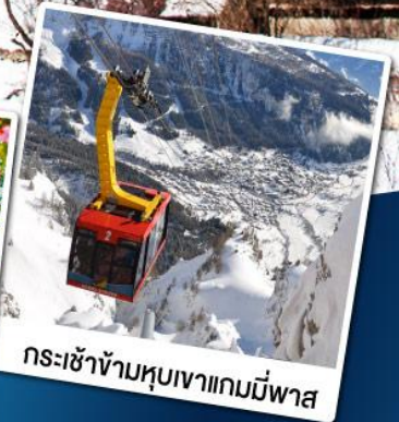
กระเช้าข้ามหุบเขาแกมมีพาส