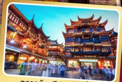
ตลาดร้อยปีฉางหวงเมี่ยว