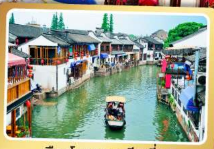
เมืองโบราณจูเจียเจียว