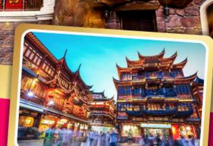
ตลาดร้อยปีเฉิงหวังเหมียว