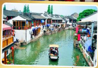
เมืองโบราณจูเจียเจียว