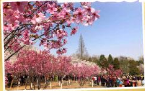
ซากุระ สวนหยุทยานถ่าน

จ่ายราคาเดียว..เที่ยวเต็มอิ่ม ..ไม่ลงร้านช้อปปิ้ง