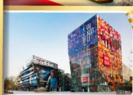
ช้อปปิ้ง SANLITUN