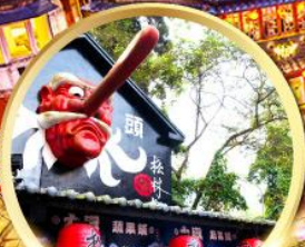
หมู่บ้านปศาจชิโก