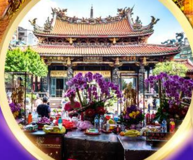
วัดหลงชาน