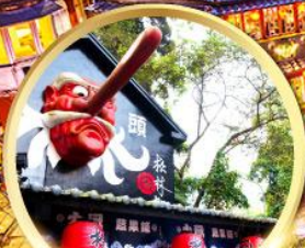
หมู่บ้านปี้คางซีโก