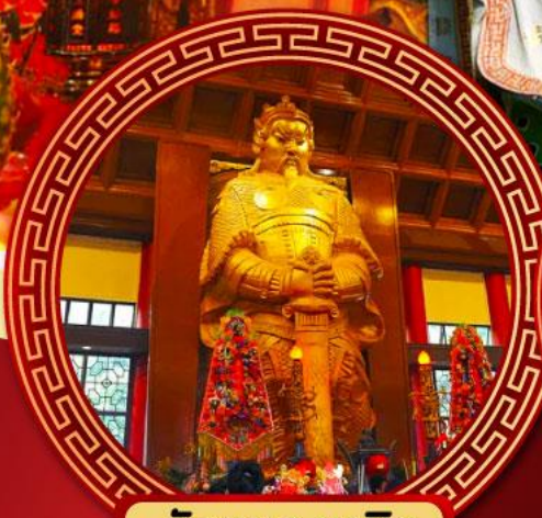
วัดเขกหมิว