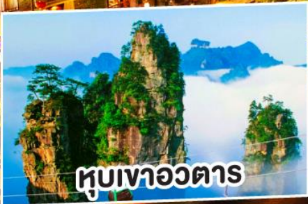
หุบเขาอวตาร