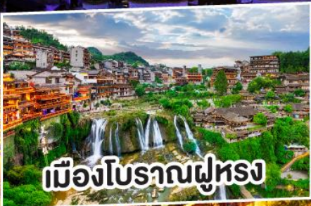
เมืองโบราณผู้ทรง