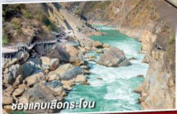
ช่องแคบเสือกะโจน