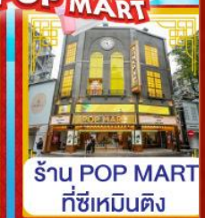
ร้าน POP MART ที่ซีเหมินติง