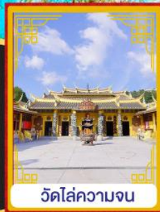
วัดไร่ความจน