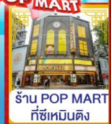
ร้าน POP MART ที่ซีเหมินติง