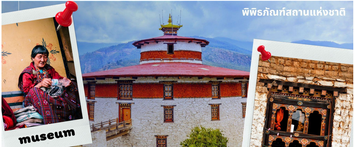
พิพิธภัณฑ์สถานแห่งชาติ

นำท่านเดินทางไม่ไกล ชม พิพิธภัณฑ์สถานแห่งชาติ พิพิธภัณฑ์แห่งนี้เป็นที่เก็บรวบรวมหน้ากากศิลปะแบบพุทธมหายาน นิกายตันตระ ภาพพระบฏ อวรุฑ์ เหริยญูษาปณ์ เครื่องมือเครื่องใช้ไม้สอยต่างๆ รวมถึงจัดแสดงความหลากหลายทางธรรมชาติอันสมบูรณ์ของประเทศเพื่อให้ทุกท่านได้รู้จักภูฏานมากขึ้น ตรงข้ามกับอาคารพิพิธภัณฑ์ เป็นอาคารทรงกลมสีขาว เรียกว่า ตาซอง (Ta Dzong) หรือ หอคอย เดิมใช้เป็นหอสังเกตการณ์ข้าศึกศัตรูเนื่องจาก สร้างอยู่บนเนินสูง สามารถมองวิวตัวเมืองพาโรได้โดยรอบ